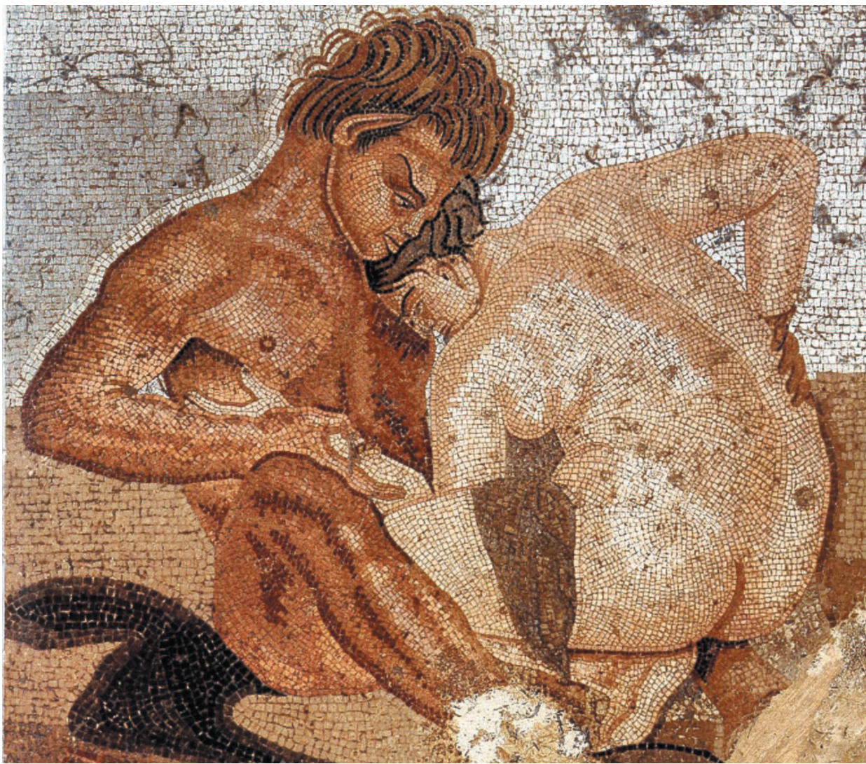
Il satiro e la ninfa. Mosaico pompeiano proveniente dalla Casa del Fauno e custodito al Museo Archeologico Nazionale di Napoli

Lussuria Nell'iconografia ottocentesca la città è luogo mitico e sensuale (qui, un particolare di un dipinto di Domenico Morelli)