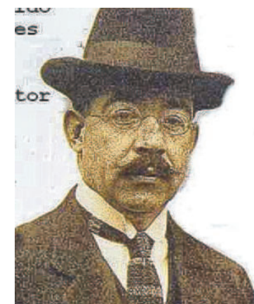
L'ambiguo Leopoldo Lugones: fu anarchico e poi fascista