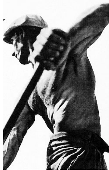
Il lavoro Sulla copertina di «Un sogno chiamato rivoluzione»

Dentro il romanzo ci sono i drammi, le utopie, le conquiste - come dire: i sogni e le rivoluzioni, appunto - che hanno costella-